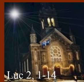
Luc 2, 1-14

En ces jours-là, parut un édit de l'empereur Auguste, ordonnant de recenser toute la terre — ce premier recensement eut lieu lorsque Quirinius était gouverneur de Syrie. — Et chacun allait se faire inscrire dans sa ville d'origine. Joseph, lui aussi, quitta la ville de Nazareth en Galilée, pour monter en Judée, à la ville de David appelée Bethléem, car il était de la maison et de la descendance de David. Il venait se faire inscrire avec Marie, son épouse, qui était enceinte. Or, pendant qu'ils étaient là, arrivèrent les jours où elle devait enfanter. Et elle mit au monde son fils premier-né ; elle l'emballota et le coucha dans une mangeoire, car il n'y avait pas de place pour eux dans la salle commune. Dans les environs se trouvaient des bergers qui passaient la nuit dans les champs pour garder leurs troupeaux. L'ange du Seigneur s'approcha, et la gloire du Seigneur les enveloppa de sa lumière. Ils furent saisis d'une grande crainte, mais l'ange leur dit : « Ne craignez pas, car voici que je viens vous annoncer une bonne nouvelle, une grande joie pour tout le peuple : Aujourd'hui vous est né un Sauveur, dans la ville de David. Il est le Messie, le Seigneur. Et voilà le signe qui vous est donné : vous trouverez un nouveau-né emmailloté et couché dans une mangeoire. » Et soudain, il y eut avec l'ange une troupe céleste innombrable, qui louait Dieu en disant : « Gloire à Dieu au plus haut des cieux, et paix sur la terre aux hommes qu'il aime. »