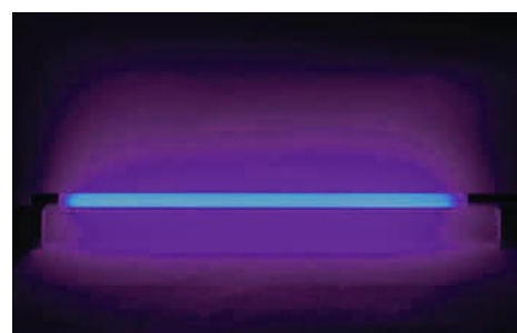
achat lumière noire (voir google)