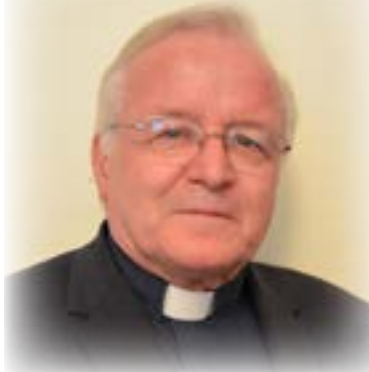
Marc 13, 24-32