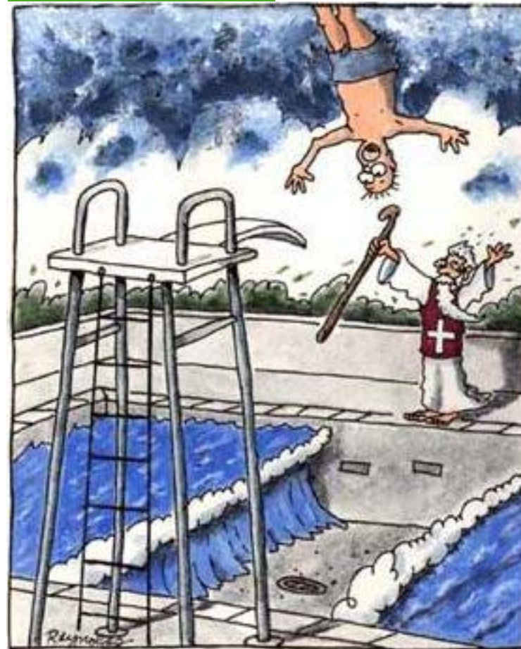
Le premier et le dernier jour de Moïse comme sauveteur