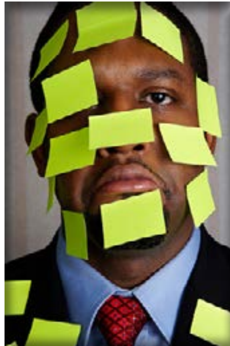
Avez-vous un message à me laisser ?