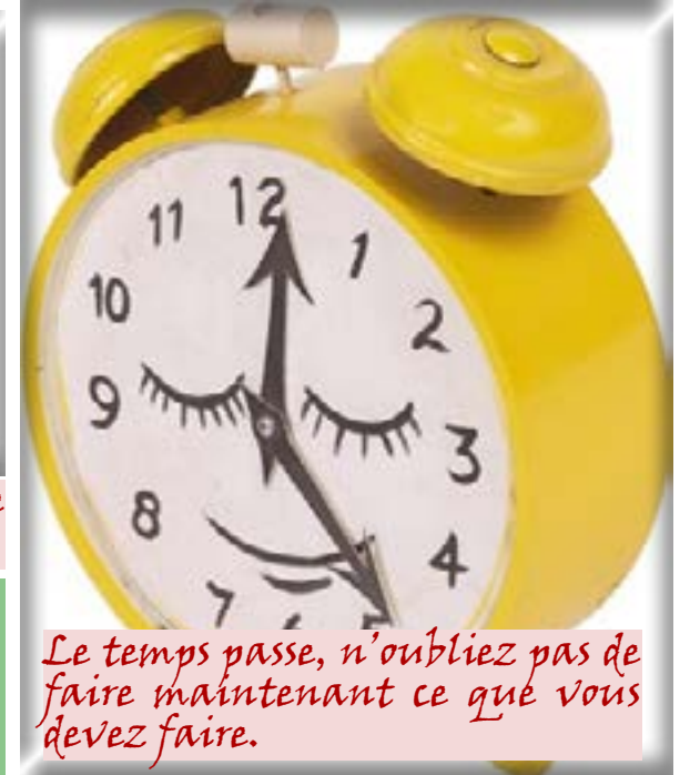
Le temps passe, n'oubliez pas de faire maintenant ce que vous devez faire.