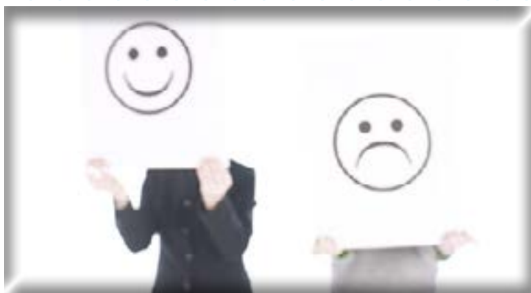
Triste ou heureux de vivre avec la Parole de Dieu

Tout désir qui appelle Dieu en nous est déjà une prière. Saint Augustin