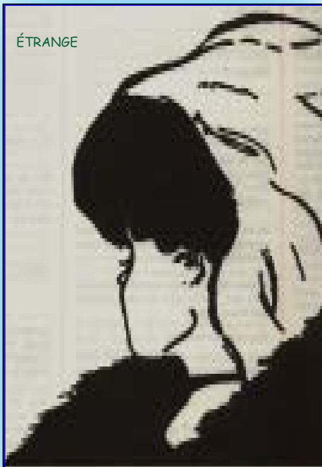
Cette dame, est-elle jeune ou âgée? Tout dépend de votre regard.