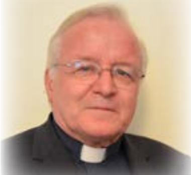
Jean 6, 1-15