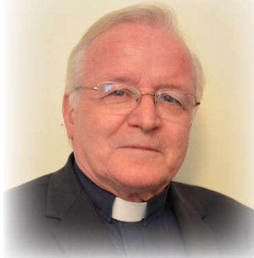
Marc 13, 24-32