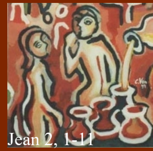
Jean 2, 1-11

Il y avait un mariage à Cana en Galilée. La mère de Jésus était là. Jésus aussi avait été invité au repas de noces avec ses disciples. Or, on manqua de vin ; la mère de Jésus lui dit : « Ils n'ont pas de vin. » Jésus lui répond : « Femme, que me veux-tu ? Mon heure n'est pas encore venue. » Sa mère dit aux serviteurs : « Faites tout ce qu'il vous dira. » Or, il y avait là six cuves de pierre pour les ablutions rituelles des Juifs ; chacune contenait environ cent litres. Jésus dit aux serviteurs : « Remplissez d'eau les cuves. » Et ils les remplirent jusqu'au bord. Il leur dit : « Maintenant, puisez, et portez-en au maître du repas. » Ils lui en portèrent. Le maître du repas goûta l'eau changée en vin. Il ne savait pas d'où venait ce vin, mais les serviteurs le savaient, eux qui avaient puisé l'eau. Alors le maître du repas interpelle le marié et lui dit : « Tout le monde sert le bon vin en premier, et, lorsque les gens ont bien bu, on apporte le moins bon. Mais toi, tu as gardé le bon vin jusqu'à maintenant. » Tel fut le commencement des signes que Jésus accomplit. C'était à Cana en Galilée. Il manifesta sa gloire, et ses disciples crurent en lui. « Remplissez d'eau les cuves. »