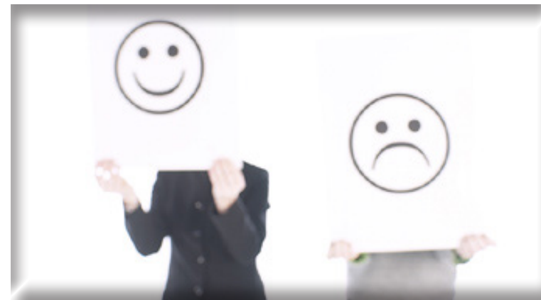
Triste ou heureux de vivre avec la Parole de Dieu

Tout désir qui appelle Dieu en nous est déjà une prière. Saint Augustin