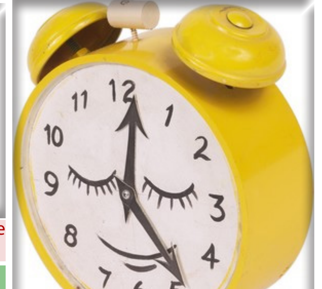
Le temps passe, n'oubliez pas de faire maintenant ce que vous devez faire.