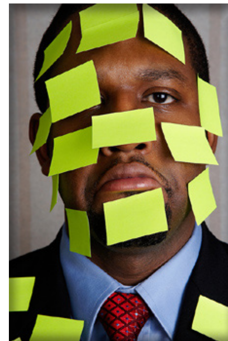
Avez-vous un message à me laisser ?