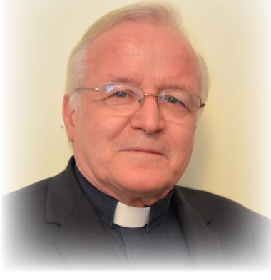
Jean 2, 13-25

« Je n'ai plus aucun espoir en l'avenir de notre pays, si les jeunes d'aujourd'hui doivent être les dirigeants de demain, car ils sont insupportables, inconscients, voire effrayants .» Hésiode, 740 avant J.C.